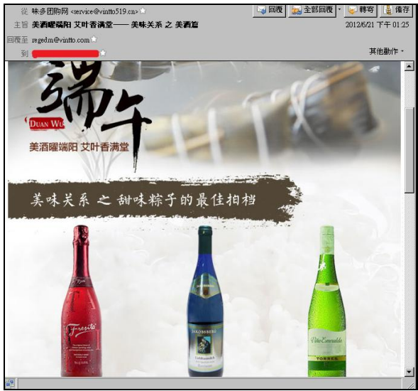
【圖 4: 中国からニセのメールマガジン】

開封率を上げるため、スパマーはスパムを正常メールに見せるように、整ったレイアウトで画像付きで作成します。また、本文に「購読キャンセル」や「このメールが閲覧できない場合、こちらをクリックしてください」といった内容を追加。見た目は正常メールに見えますが、実質はスパムです。