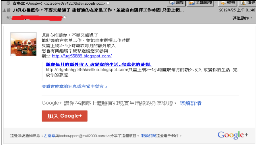
【圖 3: Google+を利用したスパムメール】

この手法は今まであった有名なメールサービスベンダー (Yahoo、Gmail、Hotmail 等) を利用してスパムを配信という手法と同じく、著名な SNS サイト (Facebook、Google+ 等) を利用してスパムを配信することに変化しました。まず、スパマーは SNS サイトのアカウントを取得。そして、開封率を上げるように SNS サイト上に公開された情報を分析して、“潜在顧客”を選定し、スパムを送ります。図 3 は Google+ から送ってきた在宅勤務をすすめるような内容のスパムです: